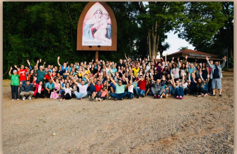
Santuário Nacional de Nossa Senhora Aparecida, em Aparecida do Norte/SP.

Acolhida aos militares, recepção da Imagem de Nossa Senhora Aparecida e entrada na Basílica. Santa Missa de homenagem da família militar a Nossa Senhora Aparecida , presidida pelo Arcebispo Militar do Brasil e seu auxiliar. Ao final, procissão de traslado da imagem com reza do Terço até a Basílica Antiga.