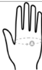
Figura Ilustrativa 01

PREGÃO ELETRÔNICO Nº 13/2018 - DICOA/DEALF/CBMDF