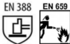
Figura ilustrativa 02

4.1.6. A luva deverá possuir etiqueta fixada no seu interior com o tamanho, nome do fabricante, pictogramas com referência a norma que a luva está certificada bem como os pictogramas conforme as exigências do item 4.1.5 deste termo nas figuras ilustrativas 02: