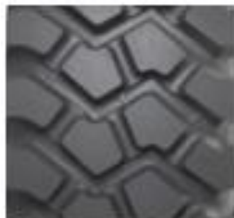
Foto do pneu original da viatura

5.2. Pneu Radial sem câmara ( tubeless tires ), com desenho da banda de rodagem do pneu para tração e uso em off road, conforme foto abaixo que corresponde ao pneu original da viatura ABTF.