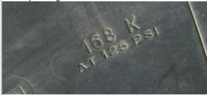
Foto do pneu original da viatura

5.4. Carga máxima não inferior (MAX. LOAD SINGLE): 5.600 kg.