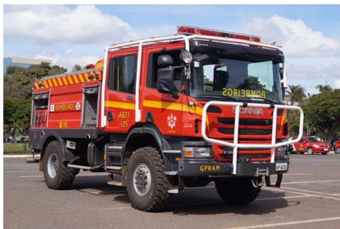
Foto : viatura ABTF do CBMDF

Há que se considerar que o Plano de Ação da Operação Verde Vivo da Corporação, que tem por missão executar serviços de prevenção e combate aos incêndios florestais, com vistas à proteção ambiental e desenvolver na comunidade a consciência para os problemas relacionados com os incêndios florestais, no âmbito do Distrito Federal, prevê que, no mínimo, 15 (quinze) viaturas do Tipo ABTF devem estar em condições de pronto emprego.