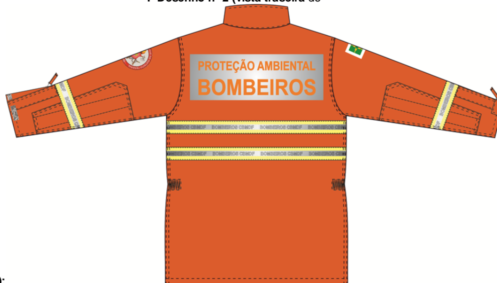
I- Desenho nº 2 (vista traseira do

PREGÃO ELETRÔNICO N.º 33.1/2014-DICOA/DEALF/CBMDF