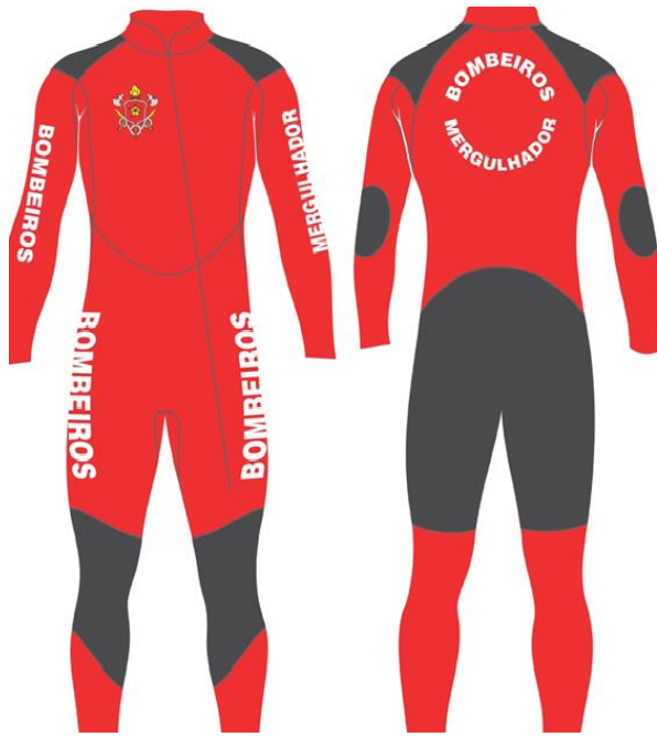
FIGURA 1 - MODELO