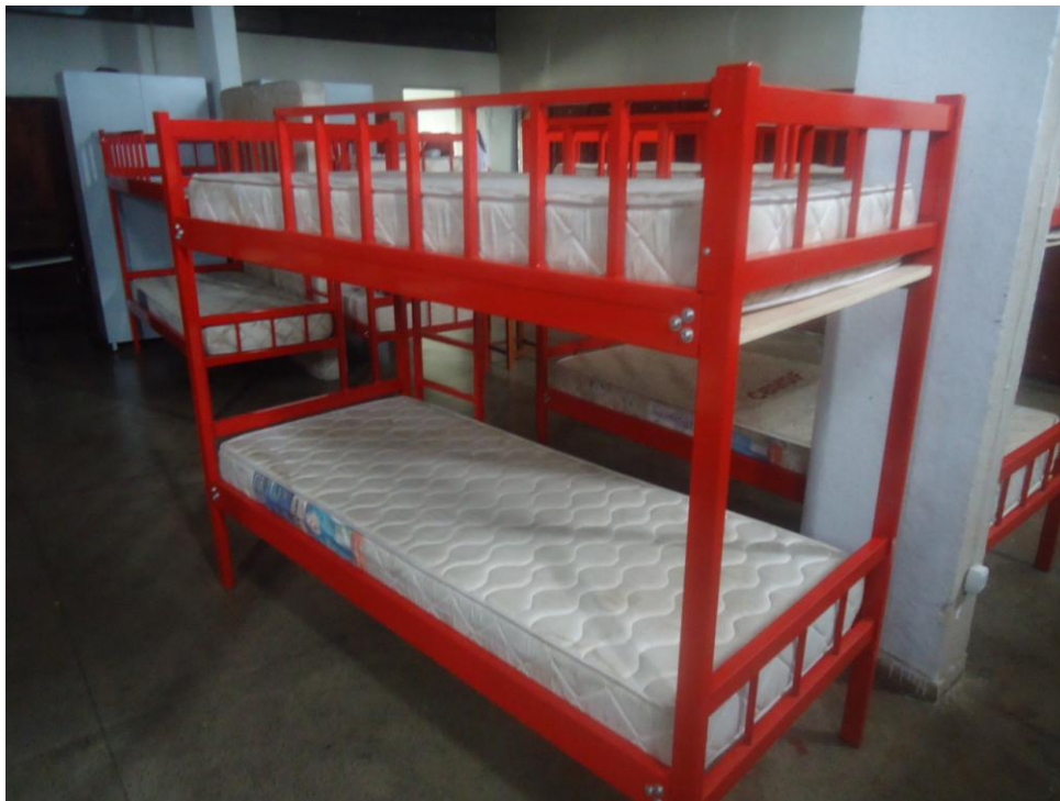
Figura 1 - Modelo do Beliche

Os beliches deverão ser fabricados de acordo com o modelo apresentado na figura 1, abaixo.