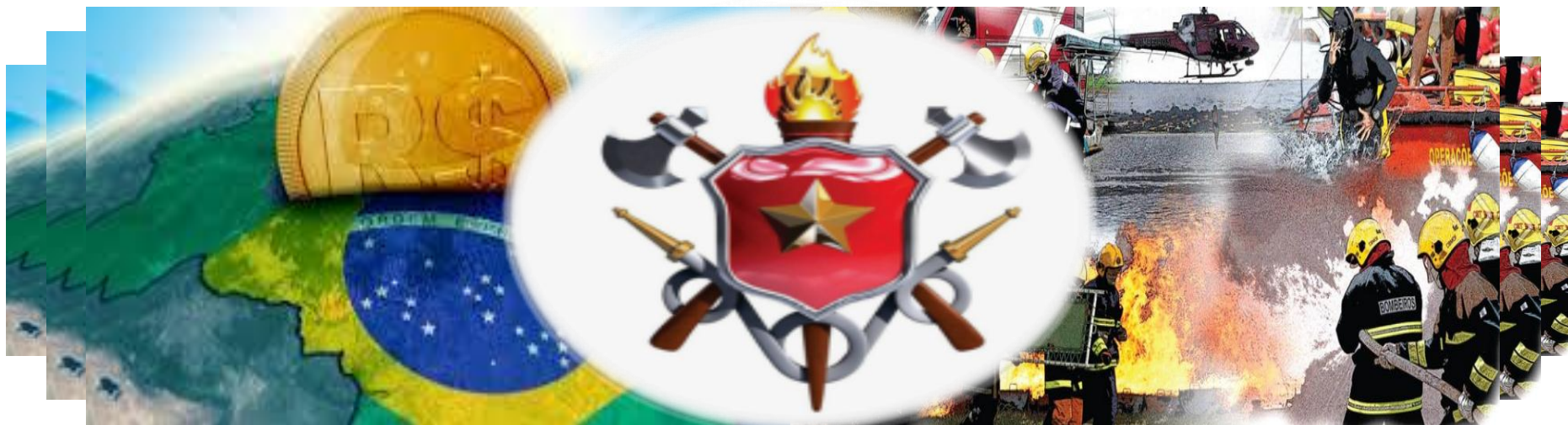
Figura 6 – Modelo de Negócio

O Corpo de Bombeiros Militar do Distrito Federal, instituição permanente, essencial à segurança pública e às atividades de defesa civil, fundamentada nos princípios da hierarquia e disciplina, força auxiliar e reserva do Exército Brasileiro, destina-se à execução de serviços de perícia, prevenção e combate a incêndios, busca e salvamento, atendimento pré-hospitalar e de prestação de socorros nos casos de sinistros, inundações, desabamentos, catástrofes, calamidades públicas e outros em que seja necessária a preservação da incolumidade das pessoas e do patrimônio (Estatuto dos Bombeiros Militar do Distrito Federal, Lei nº 7.479, de 02 de junho de 1986). Em conformidade com a Lei nº 8.255, de 20 de novembro de 1991, para que as destinações inerentes ao CBMDF tenham êxito, a organização foi estruturada em órgãos de direção, órgãos de apoio e órgãos de execução.