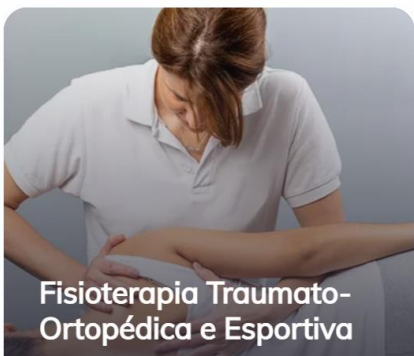
Fisioterapia Traumatológica e Esportiva