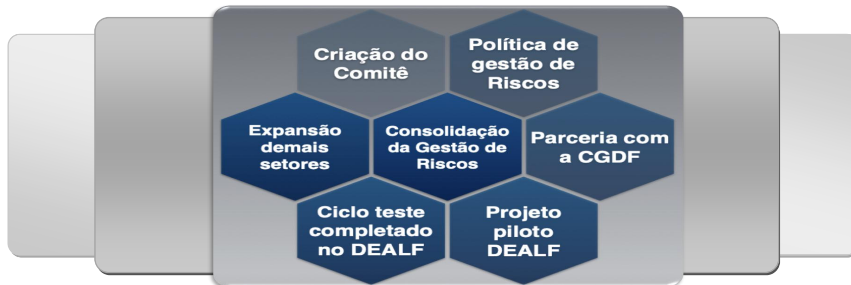
Figura 19 – Gestão de riscos

Em atendimento ao Decreto Distrital nº 37.302, de 29 de abril de 2016, que estabelece os modelos de boas práticas gerenciais em Gestão de Riscos e Controle Interno a serem adotados no âmbito da Administração Pública do Distrito Federal, e a Recomendação da Controladoria-Geral da União quanto à implantação do Sistema de Gestão de Riscos no âmbito do Fundo Constitucional do Distrito Federal, o CBMDF já concluiu a implementação da Gestão de Riscos no Departamento de Administração Logística e Financeira da Corporação.