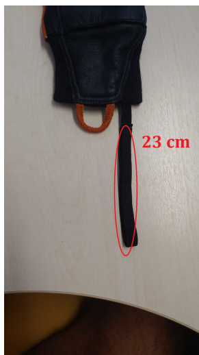
Fig. 4 - Tamanho da argola de elastano

Na parte interna da luva, costurada ao couro da luva, deverá possuir uma tira em elastano com uma argola de 23 cm de diâmetro, permitindo-se uma variação de 10%, que deverá ficar em sua totalidade externa ao punho da luva, que servirá como dispositivo anti-queda.