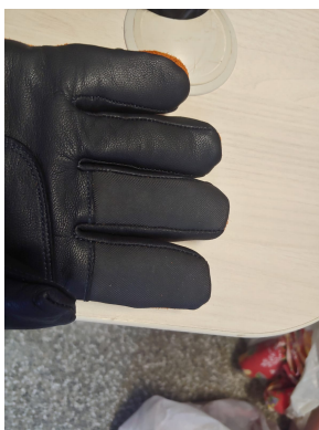
Fig. 8 - Dedos indicador e médio com material siliconado

O quantitativo dos tamanhos a serem fornecidos serão solicitados junto a cada pedido de remessa.