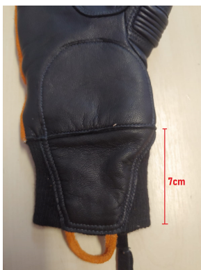
Fig.1 - Tamanho do Punho

O punho da luva (Fig. 1) deverá possuir tecido elástico de material antichama e ter 7cm de comprimento, permitindo-se uma variação de 1cm.