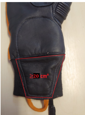
Fig. 2 - Área da proteção de artéria

A face palmar do punho, deverá possuir um protetor de artéria (Fig. 2) construído no mesmo couro da face palmar da luva, protegendo as veias e artérias do punho, de no mínimo 20 cm 2 , no prolongamento desta proteção, deverá possuir uma alça (Fig. 3), em couro resistente a fogo e a tração, com no mínimo 5 cm de comprimento.