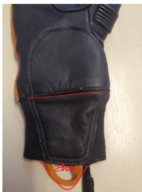
Fig. 3 - Tamanho da alça de couro

Na parte interna da luva, costurada ao couro da luva, deverá possuir uma tira em elastano com uma argola de 23 cm de diâmetro, permitindo-se uma variação de 10%, que deverá ficar em sua totalidade externa ao punho da luva, que servirá como dispositivo anti-queda.