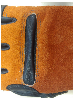
Fig. 6 - Proteção das articulações do entre o ossos do carpo e das falanges.

As regiões da palma, até a área de prolongação do dedo médio, e do polegar deverão possuir outra camada de reforço do mesmo tipo de couro, ou em para-aramida, para aumentar a resistência e a durabilidade( Fig. 7).