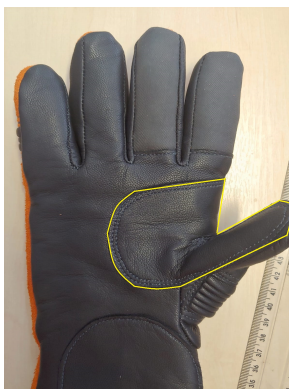
Fig. 7 - Reforço da Palmar e do polegar

As regiões da palma, até a área de prolongação do dedo médio, e do polegar deverão possuir outra camada de reforço do mesmo tipo de couro, ou em para-aramida, para aumentar a resistência e a durabilidade( Fig. 7).