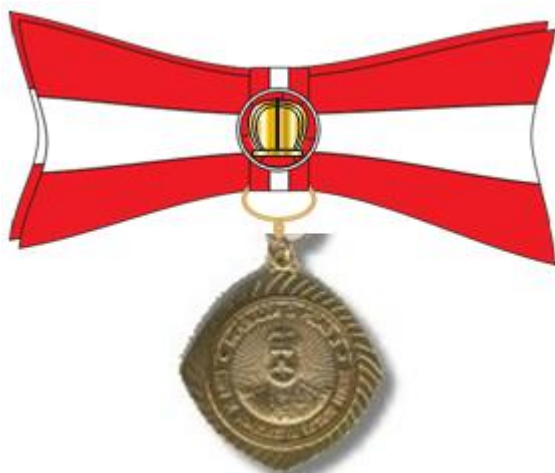
Medalha feminina grau oficial (FIGURA 6)