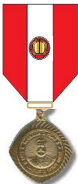
Medalha masculina grau oficial (FIGURA 4)