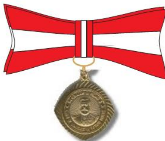
Medalha feminina grau cavaleiro (FIGURA 7)