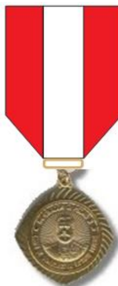
Medalha masculina grau cavaleiro (FIGURA 5)