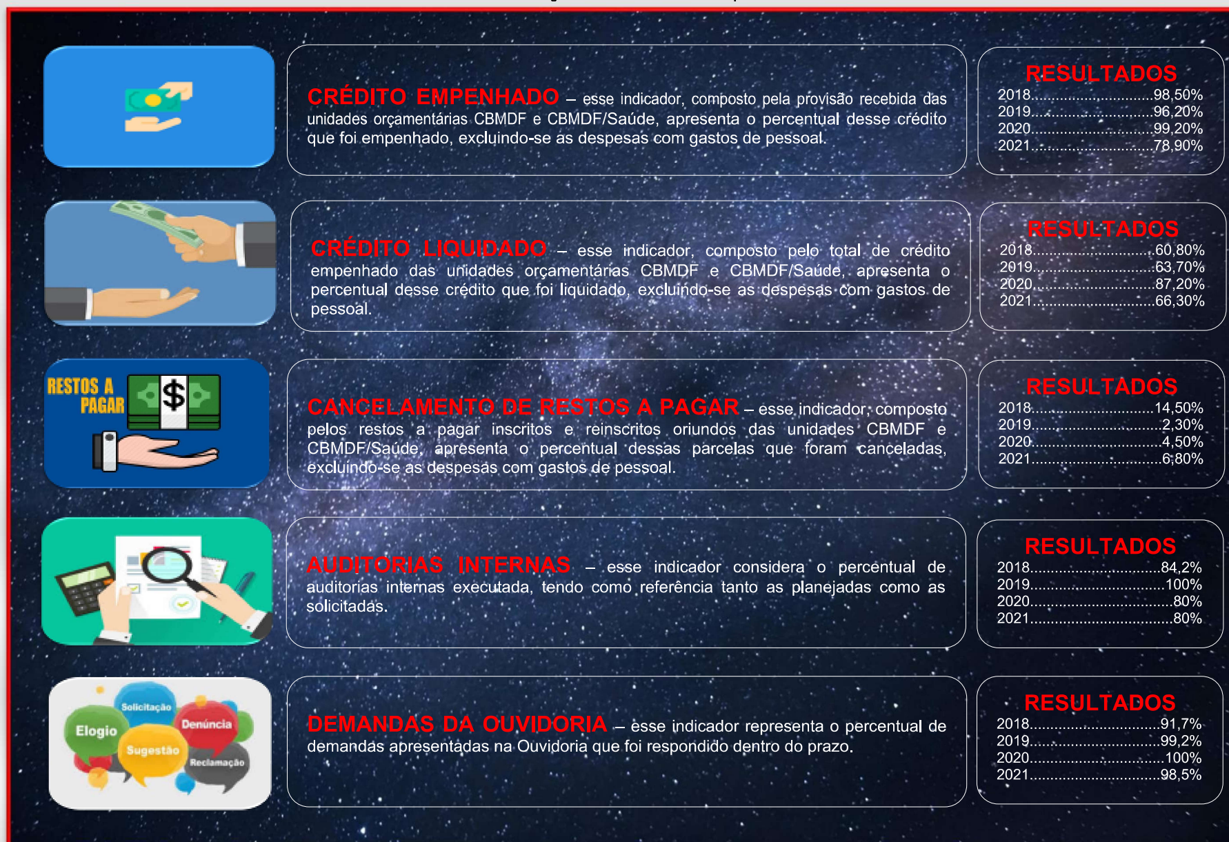
Figura 33 – Indicadores de desempenho